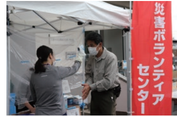
ボランティアの検温や体調チェックを徹底 (福岡県久留米市の災害 VC)