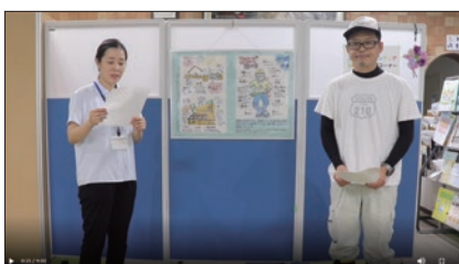
Facebookでのオリエンテーションの様子 (福岡県久留米市社協)

当日のオリエンテーションは密になることが多いと考え、Facebookに活動上の注意事項の動画を掲載し、さらに、市社協ホームページにオリエンテーションの資料を掲載するなどの工夫を行いました。活動に来る人には、事前に動画や資料を確認してもらうよう周知し、当日のオリエンテーションでは追加事項のみを伝えることとしました。