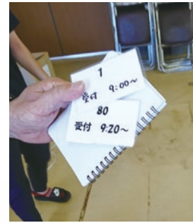
整理券を配布し20分間隔で受付を実施 (熊本県芦北町の災害VC)

災害VC内でオリエンテーション、マッチング、グルーピングを行うにあたり、会場をそれぞれ2か所設け、複雑化しました。これにより、人の流れが分散し密集しにくい状態をつくれま