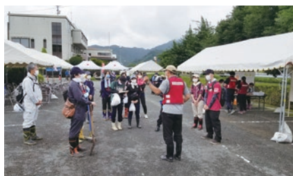
平時からの連携や訓練が素早い設置につながった (熊本県芦北町の災害VC)

府の基本的対処方針の考え方等のもと、被災地域の住民等の意見・意向等を踏まえ、行政(都道府県含む)と協議し判断するとしています。