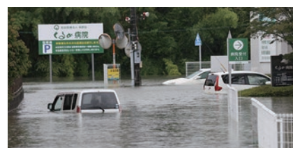
令和2年7月豪雨の被災地の様子 (福岡県久留米市内)

人的被害は166名(うち、死者・行方不明者86名)、住家被害は16,548棟を数えました(総務省消防庁:2021年2月26日現在)。