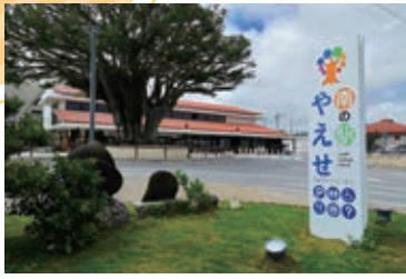
八重瀬町観光拠点施設「南の駅やえせ」

八重瀬町社協では、社会的孤立の解消・防止を目的として全34地区で「支え合い委員会」を設置、19地区で「地域窓口相談員」による定期的な相談窓口を開設している。沖縄県社協から「社会的孤立対策モデル事業」の指定を受けたことを契機