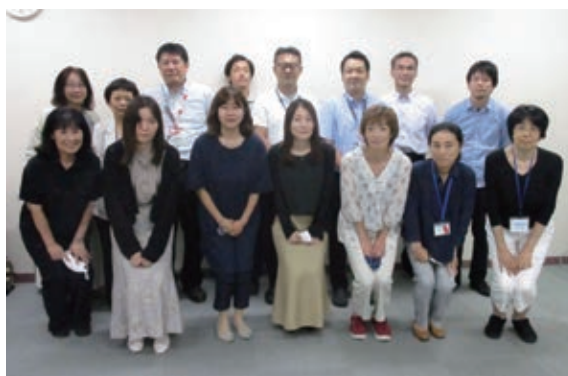
川崎市内生活福祉資金相談員・担当者

プロジェクトでは、「数のすがた」、「対応のすがた」、「職員のすがた」の3点を中心に冊子にまとめる予定です。貸付決定件数を令和元年度と2年度で比較すると141倍と激増していました。「数のすがた」を冊子にまとめる際は、急増する申請に対応した社協職員が大変だったということではなく、コロナの影響を受け、幅広い年代の多くの方が貸付制度を利用せざるを得なかった状況を伝える必要があると考えています。「対応のすがた」では、相談時に把握した状況から食料支援や他機関の支援につなげた事例や、郵送された申請書からニーズを読み取り支援につなげた事例など、特例貸付を入口とした支援事例を集めました。さらに分かりやすく伝えるために、事例をマンガで紹介しています。「職員のすがた」では、特例貸付に関わったさまざまな立場の職員にインタ