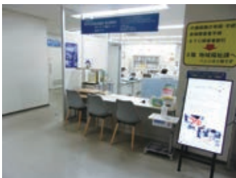
南区役所内にある社協事務所相談窓口：窓口や相談室、区役所内の会議室等を借りて相談対応を行っています。

堺市には行政区が7区あり、各区役所内に市社協区事務所を設置しています。市社協区事務所には、コミュニティソーシャルワーク機能と生活支援コーディネーター機能等を一括して担う日常生活圏域コーディネーターが、3～5小学