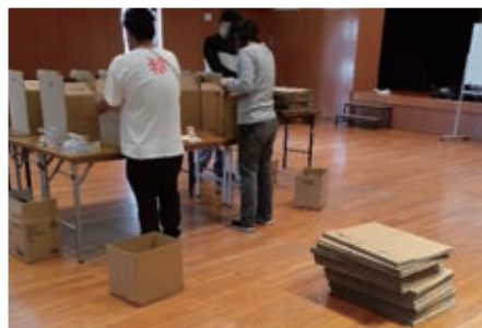
「からふらっと」メンバーによる応援パックの準備風景

これからも子どもたちや居場所の当事者一人ひとりの思いを大切にしながら、誰もが孤立しない、手を差し伸べ合える地域にしていきたいと考えています。そのためにも、多世代が集える居場所づくりに取り組み、子ども食堂、食糧支援団体とのネットワークを広げるなど、地域や市民の協力のもと、食を通じて地域活動の場を盛り上げていきたいと思っています。