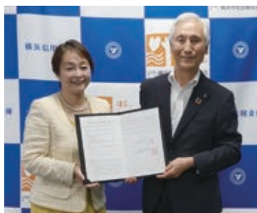
SDGsの視点を踏まえ、地域共生社会の実現をめざし包括連携協定を締結

そのなかで、約30年にわたり市社協へご寄付いただいている横浜信用金庫（以下、横浜信金）から「寄付以外にも市社協と連携したい」とのご提案があった。お互いの強みや感じている地域課題の共有などを行い、令和3年6月に「多様な主体の参画による地域福祉の推進等を目的とした包括連携協定」を締結した。