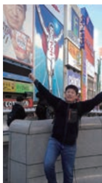
令和元年12月、道頓堀のグリコサインにて

子どもが3人いるので、普段は、仕事と子育てに追われていますが、年に1回だけ、大学時代の友人と旅行に行く機会を持っています。今までに、大阪、伊豆大島、仙台、沖縄など…コロナでここ数年は行けていませんが、年に1回の贅沢をゆるしてくれる妻に感謝です。