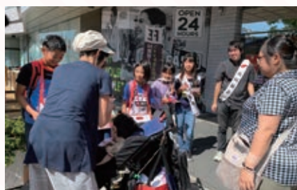
福祉交流イベントでの街頭募金の様子