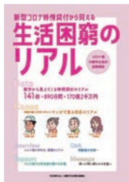
作成中の冊子の表紙

子どもが3人いるので、普段は、仕事と子育てに追われていますが、年に1回だけ、大学時代の友人と旅行に行く機会を持っています。今までに、大阪、伊豆大島、仙台、沖縄など…コロナでここ数年は行けていませんが、年に1回の贅沢をゆるしてくれる妻に感謝です。