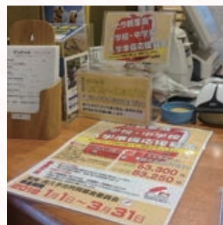
実際に使用した募金箱・宣伝物

令和3年度からは、多様なニーズに合わせ、法人の募金方法として、従来の振込や窓口への持参に加え、QRコードを活用した「インターネットによる募金」を追加した。協力いただける企業等に、より手軽で負担の少ない方法を提案