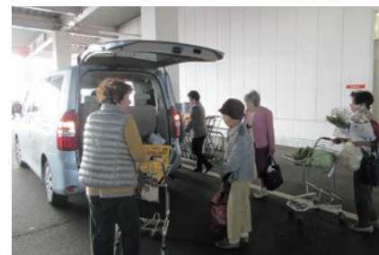
住民の毎日を支える買い物支援の意義は、今後さらに大きくなるのが予想される