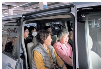
車内でのコミュニケーションも、利用者の楽しみの一つになっている