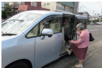
高齢化が進むにつれ、利用者にとっては車の乗り降りも容易ではなくなる

なお、地区社協では2013年にNPO法人を取得しました。「企業などの団体から寄付を受けるのに有利では」との判断からです。実際にNPO法人化したことで、事務作業が煩雑などといった面もありました。今後、新たな課題に直面した際には、その価値が試されることになるかもしれません。