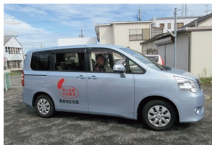
地域住民の足として活躍するワゴン車は、共同基金の助成を受けて購入された

そこで2012年、地区社協では、静岡県共同基金会からの助成金を得て8人乗りワゴン車1台を購入し、週3回の買い物支援活動を自分たちで再開