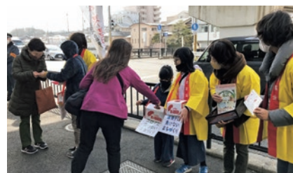
「まちづくり作戦会議」に参加した小学生とともに、駅前や街頭で募金活動に立つ。

開始前から入口で待つ人が出るほどの 盛況ぶりです。上々の評判を得て、以後、 質問会は2か月に一度のペースで開催 されています。