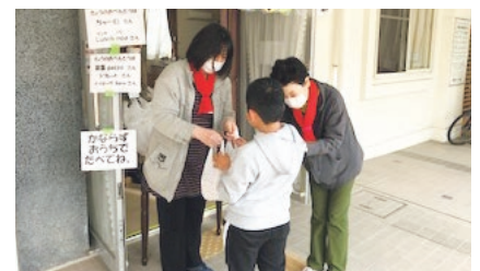
「おふくわけランチプロジェクト」では、お弁当を指定場所まで取りに来てもらった

こうして、近隣の6か所の店でお弁当をつくってもらうこと、月水金の週3日の開催とすること、メールで予約を取り、お弁当を所定の場所へ子どもたちに受け取りに来てもらうことなどが決まりました。「お弁当を取りに行くことが家から出るきっかけになり、つ