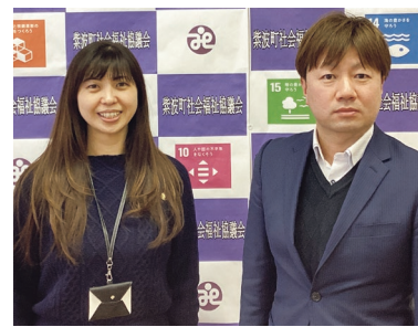
紫波町社会福祉協議会