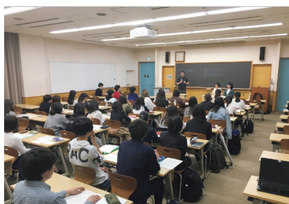
3.11 ユースダイアログの様子

他にも支援格差に対する憤りや物資を巡っての大人同士の争いへの戸惑い、本人は今もなお苦しんでいること、自身の被災規模が少なかったことで、辛い思いしてもそのことが語れず理解さ