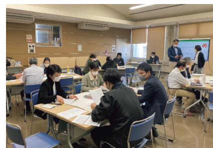
那覇市社協での研修の様子