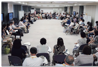
広域避難者支援ミーティングの様子

JCNでは、現在、相談対応に力を入れている支援団体とともに、現場でどのようなケースマネジメントが行われているのか、複数の事例をもとに避難者の支援において大事にすべきことを整理しています。現段階で相談された避難者の置かれている状況を受け止め、傾聴を重ねながら信頼関係をつくり、必要に応じて専門機関などなどにつなぐ対応がされていることが明らかになっています。まさに、避難者に特化したソーシャルワークが展開されており、その内容は各地で尽力されているコミュニティソーシャルワークと重なるものがあるのではないのでしょうか。