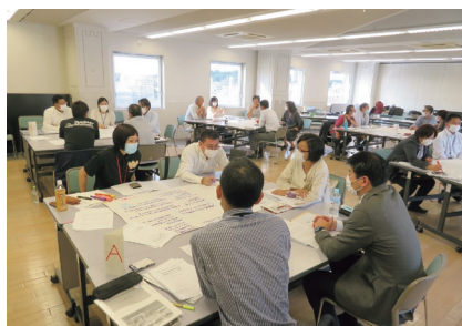
社協職員等を対象にした会議の様子

沖縄じゃんがら会の避難者支援ネットワーク会議(研修などのプロジェクト)を通して、当事者にしか分からない気持ちや生きづらさの背景を知ること、支援の『言葉の重み』や当事者を多面的に捉える事を学びました。また、これまでともすれば部署間の縦割りになりがちな相談支援体制を改めるきっかけとなりました。今後は、共通の相談ツールの導入や職員の相談対応力向上に努め、社協内の部署を横断して受け止めるヨコの連携へと見直しを図り、避難者を含めた平時からの『断らない相談支援』を展開していきたいと思えます。