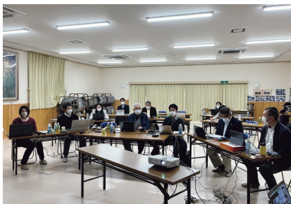
3.11 今がわかる会議の様子

そこで、こうした被災地の状況を多くの方に知ってもらうことを目的に、JCNでは「3.11の今がわかる会議」(以下、会議)を2017年から毎年開催しています。主に岩手や宮城、福島を拠点に活動する団体から、地域の状況や活動を通じて見てきた課題に対する取