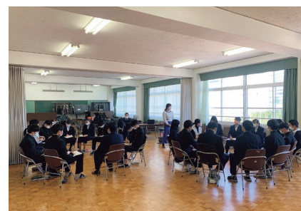
3.11 ユースダイアログの様子