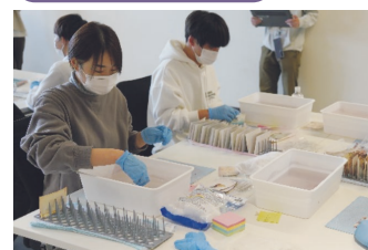
写真洗浄は、誰でも気軽に取り組むことができる活動です